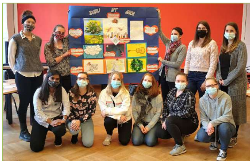
Certificat du Fondamental - Module de didactique 2021