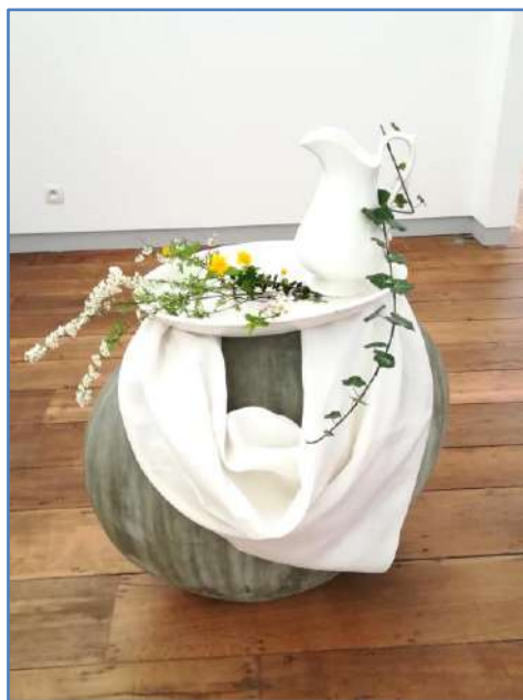
Jeudi-Saint 2021 - chapelle Espace Prémontrés