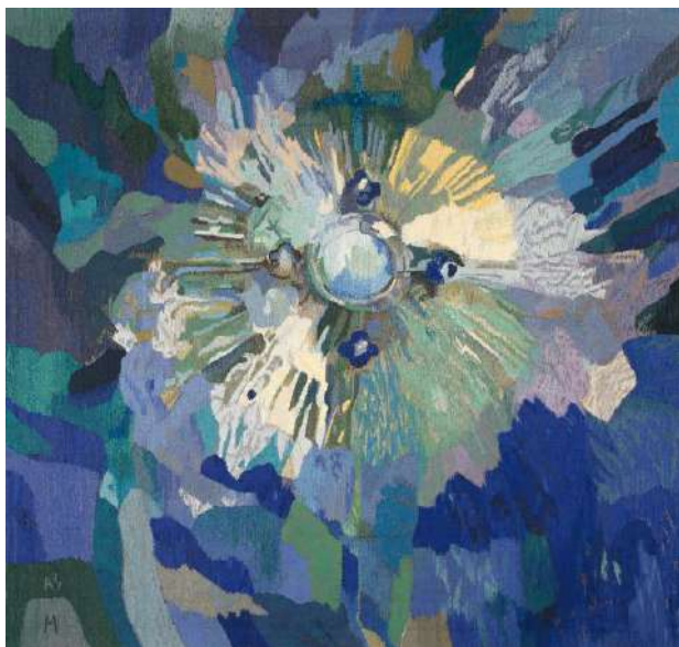
St Sacrement Bleu - Malel