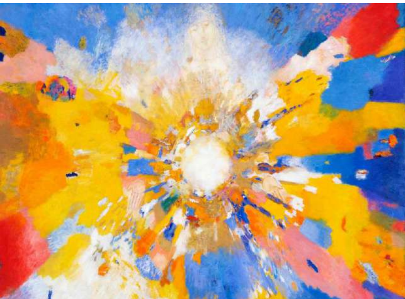
MALEL « Saint-Sacrement de Pellevoisin », avec l'aimable autorisation de l'auteur