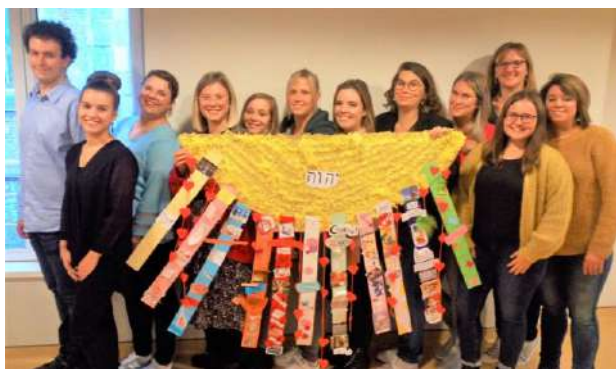
Certificat du fondamental – module de didactique