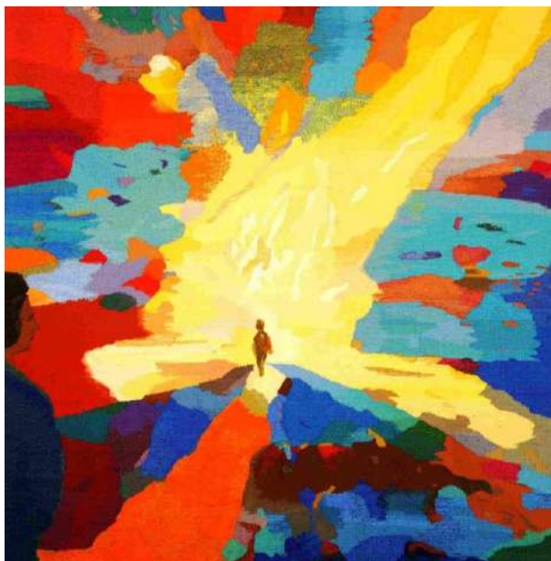
L'enfant et la vie - Malel