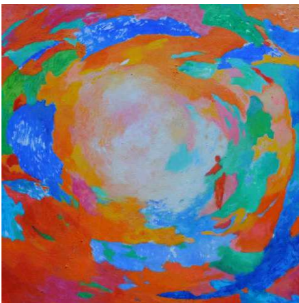
Esprit - Malev

21/1, 28/1, 4/2, 11/2, 25/2, 4/3, 11/3, 18/3, 25/3