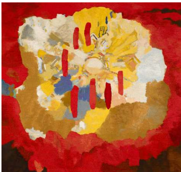
Hommage aux frères de Tibhirine - Malel