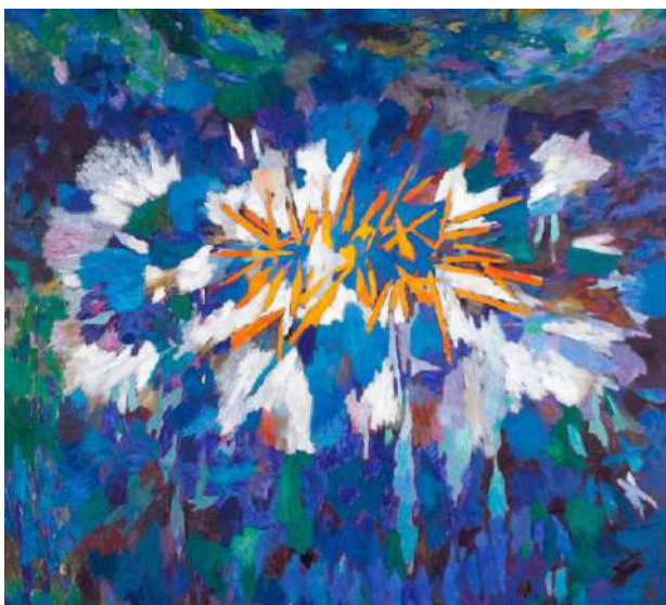
Couronne de gloire – Malel