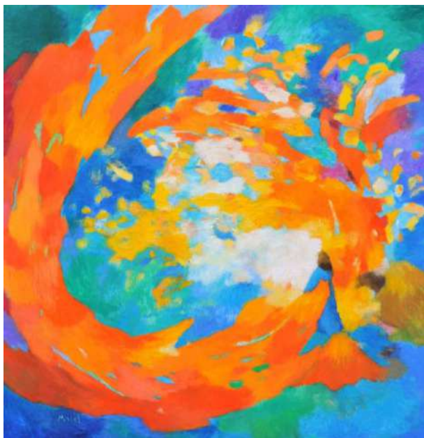
La femme et l'esprit - Malel

et 2 jeudis de 19h30 à 21h20 : 4/3 et 11/3