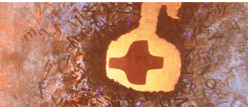
ARCABAS « Il leur ouvrit les Écritures » (polyptique « Les Pèlerins d'Emmaüs ») Comunità Pitturello à Torre de Roveri (Bergame), Italie avec l'aimable autorisation de l'auteur

Vicariat de la formation CDF : ISCP - Séminaire Rue des Prémontrés, 40 – 4000 Liège Tél. : 04/220 53 73 – 04/223 73 93 Fax : 04/223 76 93 – iscp@scarlet.be http://espacepremontres.be Éditeur responsable : E. Piront