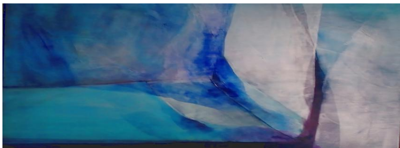
Hervé BORBÉ, «Composition» huile sur toile, expo Mobil'Art 2015 à l'Espace Prémontrés