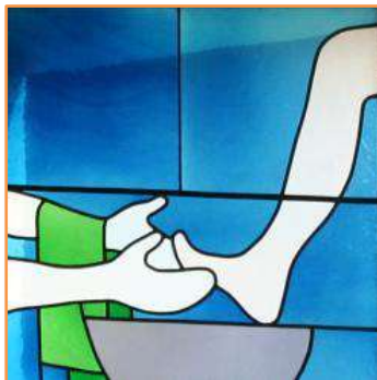
Le lavement des pieds, vitrail de Max Ruedi au couvent dominicain d'Ilanz (Suisse)

Afin de laisser à notre Évêque et à son équipe le temps de discerner de l'opportunité de l'entrée en pré-cheminement, il est demandé à la personne de se présenter autant que possible avant la fin du mois de mai .