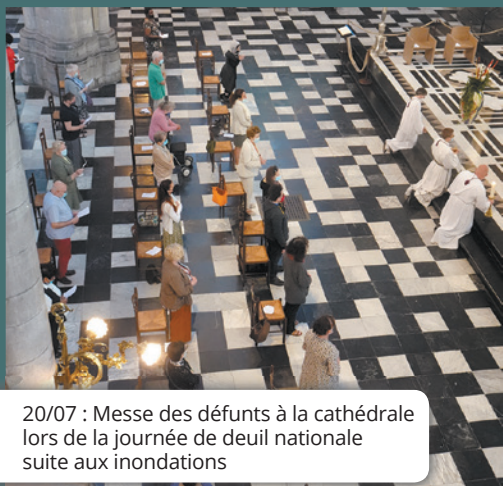
20/07 : Messe des défunts à la cathédrale lors de la journée de deuil nationale suite aux inondations