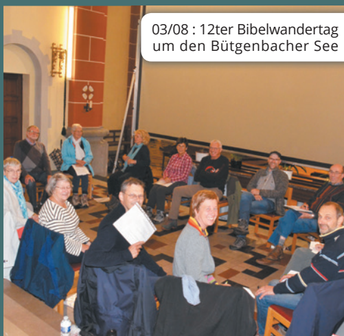
03/08 : 12ter Bibelwandertag um den Bütgenbacher See