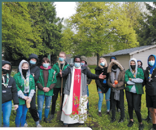
17/05 : Semaine Laudato si' du 16 au 25 mai à Ferrières