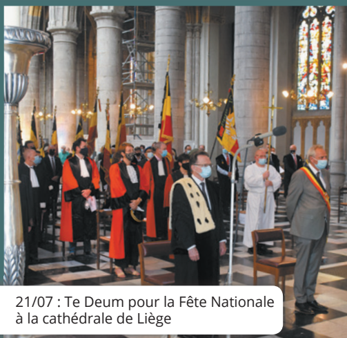
21/07 : Te Deum pour la Fête Nationale à la cathédrale de Liège