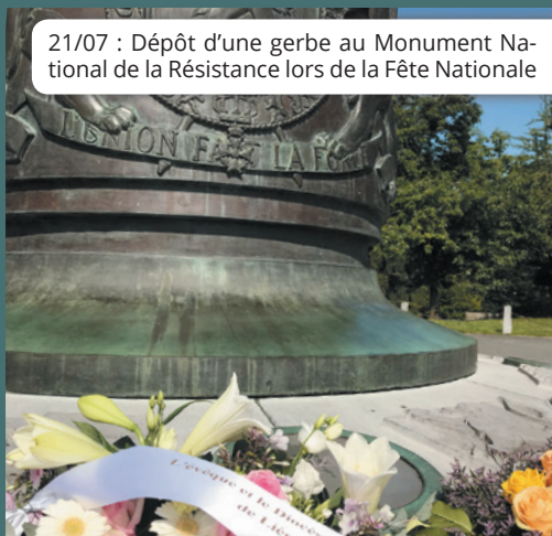
21/07 : Dépôt d'une gerbe au Monument National de la Résistance lors de la Fête Nationale