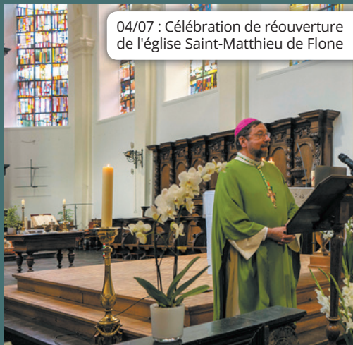
04/07 : Célébration de réouverture de l'église Saint-Mathieu de Flone