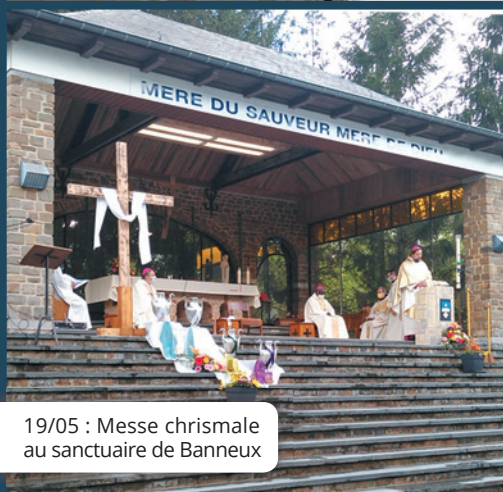
19/05 : Messe chrismale au sanctuaire de Banneux