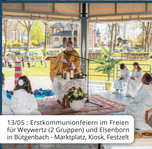
13/05 : Erstkommunionfeiern im Freien für Weywertz (2 Gruppen) und Elsenborn in Bütgenbach - Marktplatz, Kiosk, Festzelt