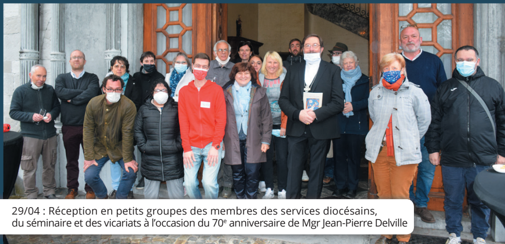
29/04 : Réception en petits groupes des membres des services diocésains, du séminaire et des vicariats à l'occasion du 70 e anniversaire de Mgr Jean-Pierre Delville