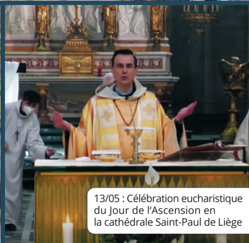
13/05 : Célébration eucharistique du Jour de l'Ascension en la cathédrale Saint-Paul de Liège