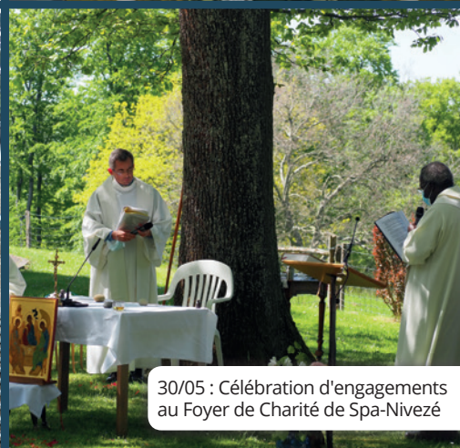
30/05 : Célébration d'engagements au Foyer de Charité de Spa-Nivezé