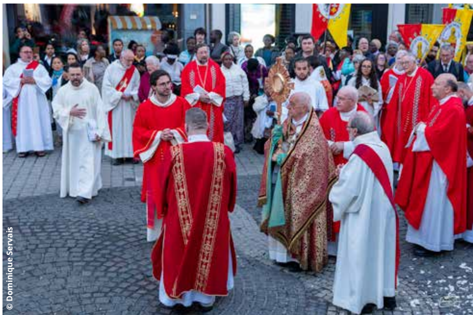
Le cardinal Fernando Filoni (ici en train de porter le Saint Sacrement) a rehaussé de sa présence cette 780 e Fête-Dieu à Liège.

Environ un millier de personnes se sont réunies pour la 780 e Fête-Dieu. Célébrée en présence de plusieurs autorités religieuses, cette fête pluriséculaire a encore une fois animé le cœur de la Cité Ardente et de ses citoyens.