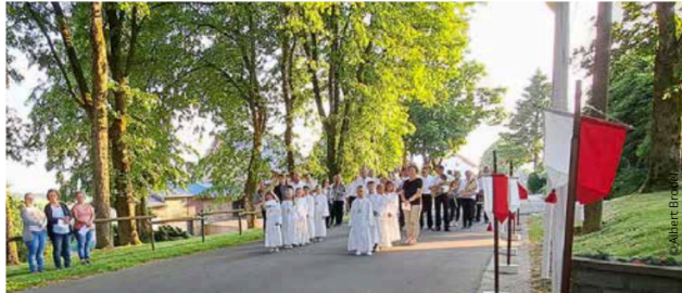
Procession de la Fête-Dieu à Mürringen, avec les enfants de première communion de Hünningen et Mürringen, un beau symbole de l'investissement des communions dans la vie paroissiale.

Si le week-end de l'Ascension rime souvent avec fêtes de la foi, une particularité distingue les cantons de l'Est: ici, pas de profession de foi! Ce rite, qui n'est pas un sacrement, n'est pas célébré côté